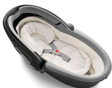
Автокресло «люлька» группы 0 для детей массой менее 10 кг

Детские удерживающие устройства подразделяют на 5 весовых групп: